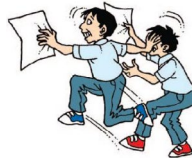
UN CONFLICTO O PELEA