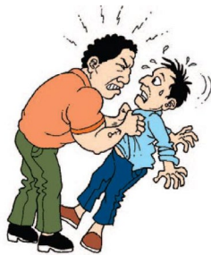
LA DISPUTA POR EL PODER