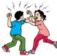
UN GOLPE O DOLOR FÍSICO

1.) Señale con una X LO QUE DEBE ESTAR NECESARIAMENTE PRESENTE en una situación para que pueda ser catalogada como violencia. Solo puede señalar una opción.